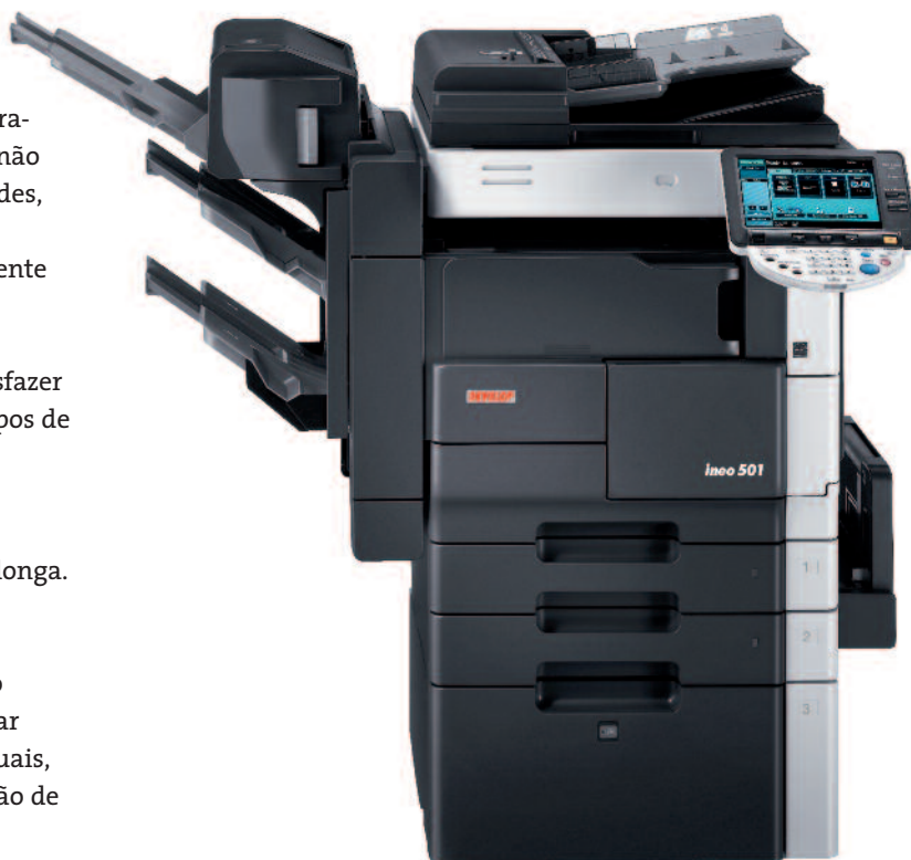
ineo 501 com finalizador incorporado FS-522, kit de agrafagem de lombada SD-507 e a cassette de grande capacidade PC-407

de utilizar, graça especialmente ao grande painel de operação com ecrã a cores. No mundo monótono dos equipamentos de escritório monocromáticos, estas funcionalidades distintas fazem uma grande diferença.