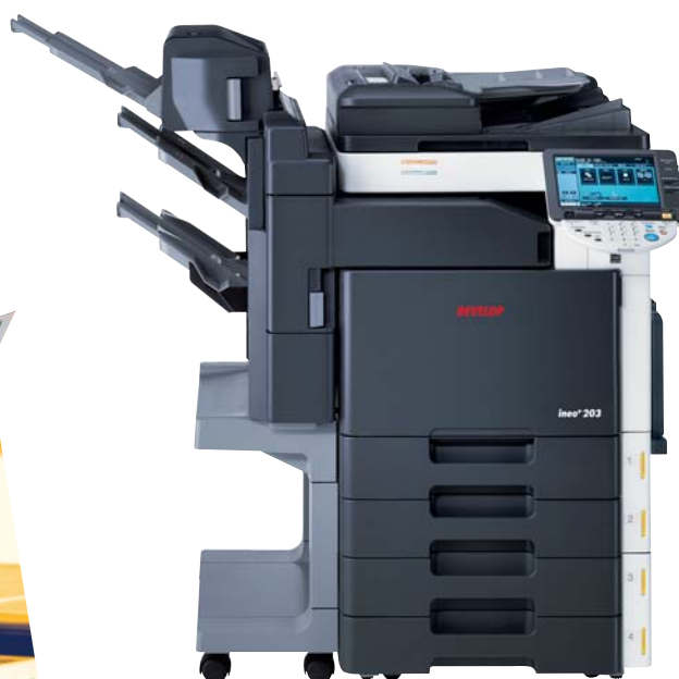
ineo + 203 com alimentador de documentos (DF-611), finalizador integrado (FS-519), kit agrafar em sela (SD-505) e 2 cassetes universais (PC-204)