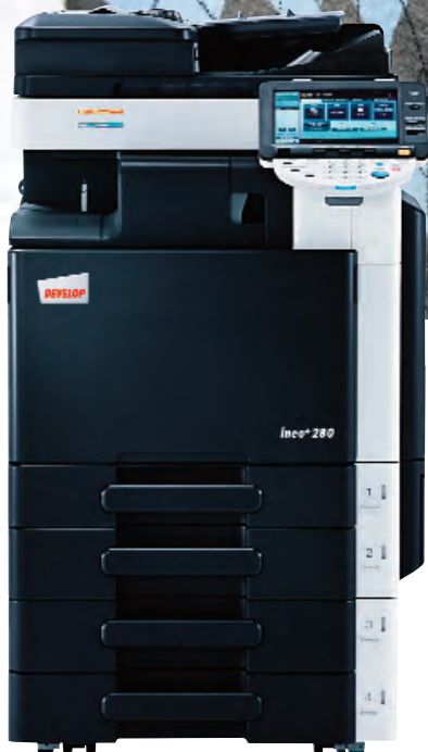
ineo+ 280 com alimentador de documentos (DF-617), finalizador integrado (FS-529) e ta-buleiro universal de 2 x 500 folhas (PC-207)