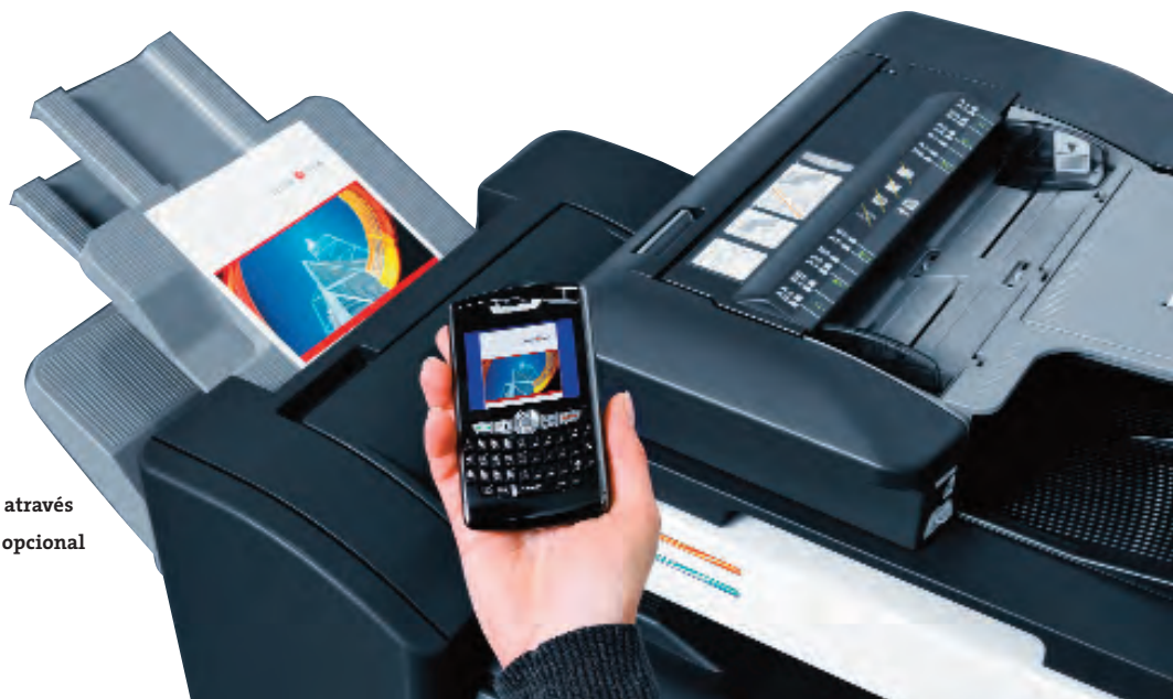
Impressão móvel possível através de uma ligação bluetooth opcional