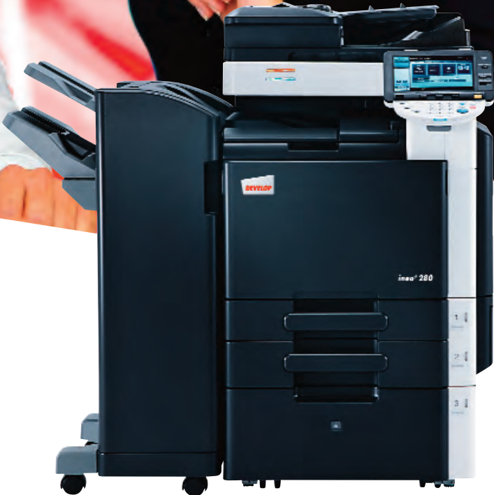
ineo+ 280 com alimentador de documentos (DF-617), finalizador de chão (FS-527) e tabuleiro de grande capacidade (PC-408)