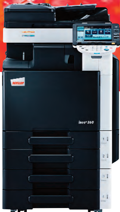
ineo+ 360 com alimentador de documentos (DF-617), finalizador integrado (FS-529) e tabuleiro universal de 2 x 500 folhas (PC-207)