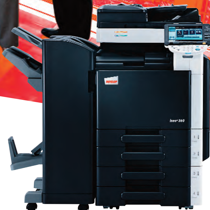
ineo+ 360 com alimentador de documentos (DF-617), finalizador de chão (FS-527), kit de agrafar em sela (SD-509) e tabuleiro universal de 2 x 500 folhas (PC-207)