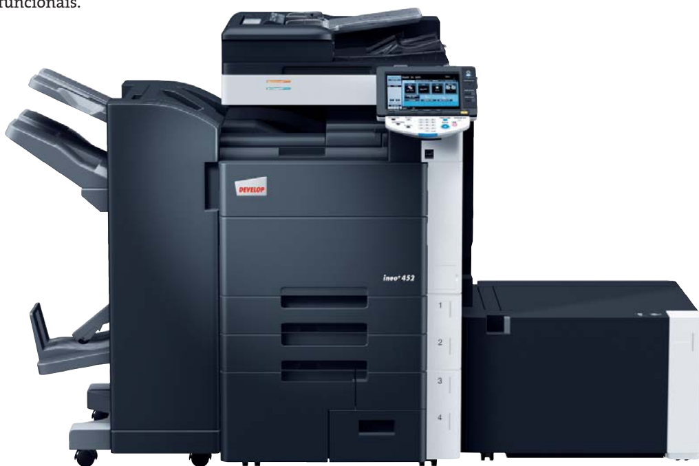
ineo+ 452 com finalizador agrafador (FS-527), kit de agrafar em sela (SD-509) e tabuleiro de grande capacidade (LU-204)