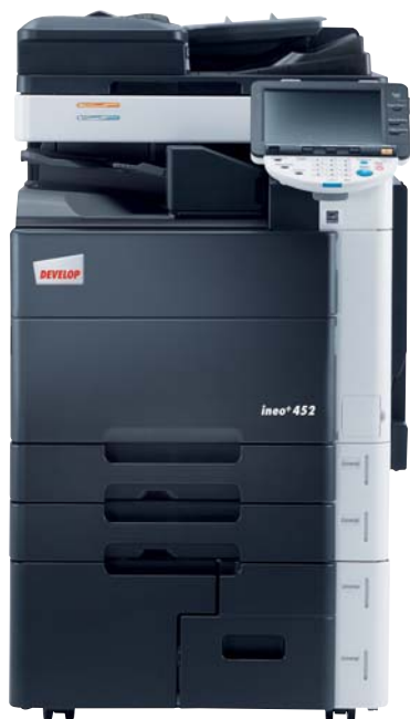
ineo+ 452 com separador de trabalhos (JS-504)

Um dos princípios orientadores da Develop é mostrar a nossa responsabilidade pelas gerações futuras, respeitando o ambiente. Como comprova a atribuição dos prémios Blue Angel ou Energy Star para aparelhos como o ineo+ 452. Contudo, o perfil ambiental deste sistema é exemplar em mais do que um sentido. A produção de toner polimerizado, por exemplo, gera menos 40% de emissões de CO 2 que a do toner convencional; mais de 90% dos componentes da DEVELOP podem ser reciclados; e os sistemas do ineo apenas gastam electricidade quando estão de facto a funcionar e desligam-se automaticamente quando não estão a uso.