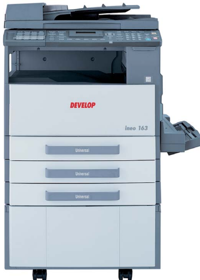
ineo 163 com alimentador documentos DF-502, bypass múltiplo MB-501, armário pequeno e duas cassetes de papel PF-502

O ineo 163/213 é a solução ideal para o escritório doméstico ou pequenas empresas, para utilizadores de copiadoras analógicas que necessitam de mais funcionalidade ou utilizadores de impressoras a jacto de tinta que desejam poupar tempo e dinheiro. Para gestores que querem introduzir a impressão e a digitalização em rede e para as empresas que procuram mais do que o A4. Este multifuncional compacto oferece mais valor pelo investimento.