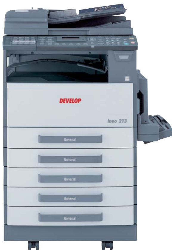
ineo 213 com alimentador duplex DF-605, unidade duplex AD-504, bypass múltiplo MB-501 e quatro cassetes de papel PF-502

A multifuncionalidade é por vezes desprezada porque muitos destes equipamentos maximizam a funcionalidade minimizando o desempenho. Mas o ineo 163/213 é diferente. Este equipamento oferece todas as vantagens da multifuncionalidade sem comprometer o desempenho. Funções de cópia e impressão GDI, comunicação melhorada no escritório e na rede, recursos de informação partilhados, mais produtividade, operação fácil e baixo custo de utilização são benefícios reais num pequeno escritório.