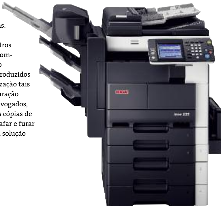
ineo 222/282/362 com finalizador incorporado (FS-530), unidade de lombadas (SD-507), cassette de papel (PC-206) e alimentador de documentos (DF-620)

O ineo 222/282/362 não só imprime e copia com standards profissionais como também oferece uma vasta gama de funções de digitalização úteis tais como digitalizar para email, permitindo que os documentos digitalizados sejam enviados directamente para um endereço de email. Os utilizadores podem também digitalizar e imprimir a partir de uma box opcional protegida por palavra-passe, o que disponibiliza espaço de armazenamento a cada utilizador no disco do sistema. Os documentos, por exemplo, podem ser armazenados nessa box prontos para reimpressão - uma funcionalidade conveniente fazendo com que não seja necessário reabrir o documento num PC.