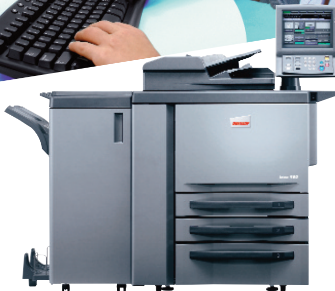
ineo 950 com finalizador de brochuras FS-611