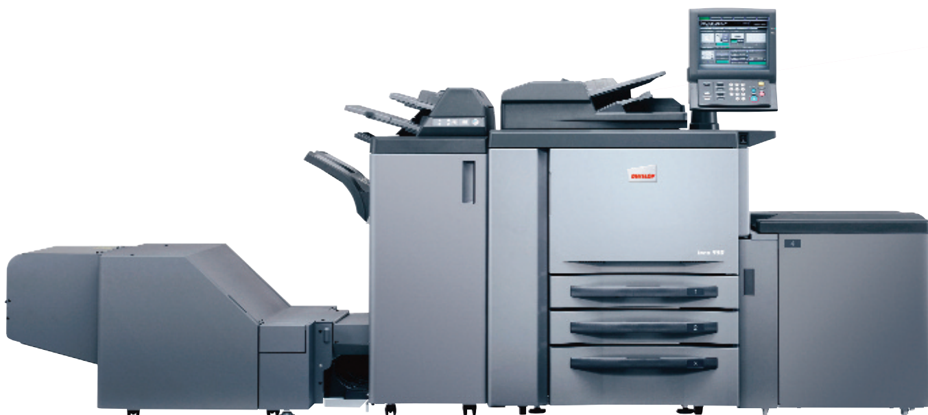
ineo 950 com finalizador de brochuras FS-611, insersor de pré-impressos PI-506, cassete de grande capacidade LU-408 e unidade de aparo TU-502

Se o seu negócio crescer, pode simplesmente anexar um segundo ineo 950 ao primeiro, duplicando as suas saídas. O software de impressão tandem – normalmente um extra dispendioso – está pré-instalado neste sistema, pelo que tudo o que necessita é de um cabo normal de ethernet e o controlador de série ineo. Dois ineos 950 em simultâneo imprimem 190 páginas por minutos, que é a velocidade que necessita em trabalhos volumosos tais como apresentações que devem ser produzidas em prazos curtos. A impressão tandem coloca o ineo 950 em dimensões de performance de equipamentos com produção bem estabelecida – mas dois ineos 950 representam um custo bem menor. Apenas um dos muitos motivos para investir num ineo é o de melhorar o seu negócio.