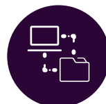
MANAGED CONTENT SERVICES