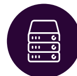
INFRASTRUCTURE MANAGED SERVICES

OFERTA COMPLEMENTAR AO HARDWARE DE PRINTING