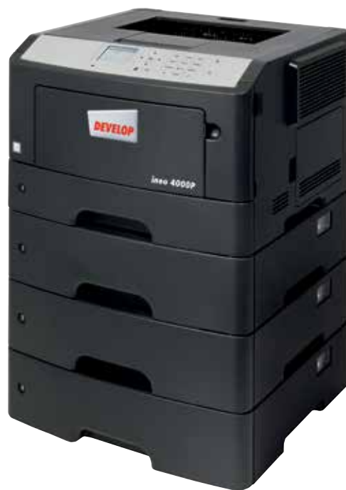
ineo 4000P com 3 cassetes adicionais de 550 folhas (PF-P11)

Caso o sistema operativo da sua impressora atual seja difícil de seguir e o equipamento seja difícil de usar, está na hora de considerar mudar para a ineo 4000P. O seu painel a cores de 2.4 polegadas garante uma operacionalidade intuitiva e menus destacados mostram aos utilizadores o estado do sistema, opções de operação e configurações. E mais, um conceito de navegação tipo pasta significa que a ineo 4000P é mais fácil de utilizar que qualquer outro sistema mais antigo. Isto poupa tempo e esforço à sua equipa na impressão de trabalhos diários. E ninguém terá de consultar o manual de operador antes de usar esta nova impressora.