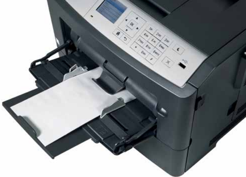
Tabuleiro de multi-uso para a impressão em suportes especiais como envelopes

Trabalhos de impressão de alto volume são comuns no seu negócio? Com uma capacidade máxima de 2,000 folhas pode ter a certeza de que a ineo 4000P não ficará sem papel. E caso frequentemente imprima em vários tipos de papel, por exemplo com ou sem papel timbrado, poderá equipar a sua ineo 4000P com até três cassetes de papel (com 250 ou 550 folhas). Caso as cassetes tenham papel de tipo, formato e gramagem diferente (A6-A4 e 60-163 g/m 2 ), poderá garantir que a sua equipa não perde tempo trocando de um tipo de papel para o outro, ou voltar para a impressora que ficou sem papel.