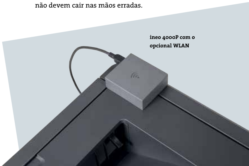
ineo 4000P com o opcional WLAN