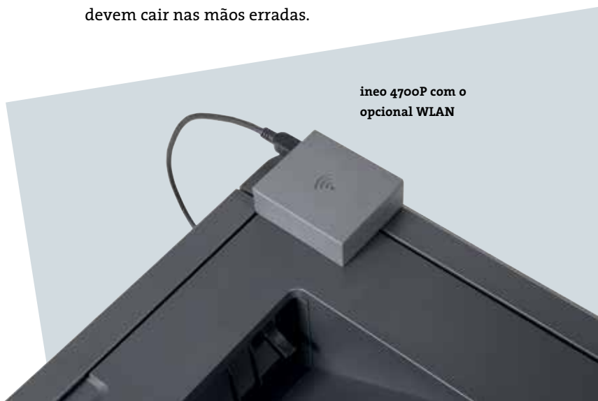
ineo 4700P com o opcional WLAN

Caso não tenha muito espaço no seu escritório ou precisa mesmo de uma impressora de mesa, o desenho leve e pegada reduzida da ineo 4700P são uma grande vantagem. O facto que esta impressora eficiente de escritório poderá ser colocada com facilidade em cima de uma mesa e não precisa de um próprio espaço, é extremamente conveniente para uma equipa por exemplo num departamento de RH ou financeiro, onde documentos confidenciais não devem cair nas mãos erradas.