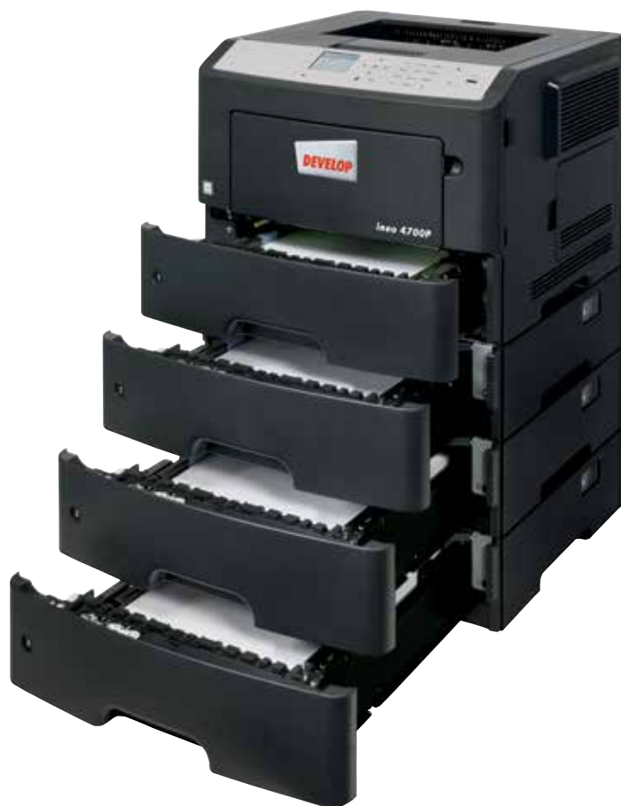
ineo 4000P com 3 cassetes adicionais (PF-P12)

Caso o sistema operativo da sua impressora atual seja difícil de seguir e o equipamento seja difícil de usar, está na hora de considerar mudar para a ineo 4700P. O seu painel a cores de 2.4 polegadas garante uma operacionalidade intuitiva e menus destacados mostram aos utilizadores o estado do sistema, opções de operação e configurações. E mais, um conceito de navegação tipo pasta significa que a ineo 4700P é mais fácil de utilizar que qualquer outro sistema mais antigo. Isto poupa tempo e esforço à sua equipa na impressão de trabalhos diários. E ninguém terá de consultar o manual de operador antes de usar esta nova impressora.