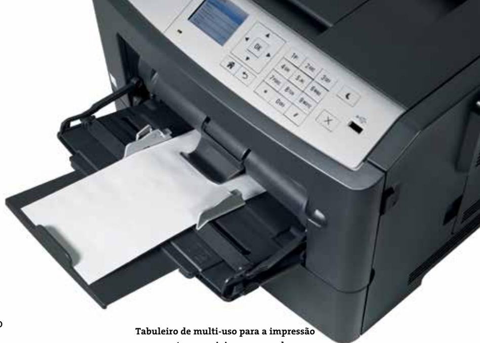
Tabuleiro de multi-uso para a impressão em suportes especiais como envelopes

Trabalhos de impressão de alto volume são comuns no seu negócio? Com uma capacidade máxima de 2,300 folhas pode ter a certeza de que a ineo 4700P não ficará sem papel. E caso frequentemente imprima em vários tipos de papel, por exemplo com ou sem papel timbrado, poderá equipar a sua ineo 4700P com até três cassetes de papel (com 250 ou 550 folhas). Caso as cassetes tenham papel de tipo, formato e gramagem diferente (A6-A4 e 60-163 grs), poderá garantir que a sua equipa não perde tempo trocando de um tipo de papel para o outro, ou voltar para a impressora que ficou sem papel.