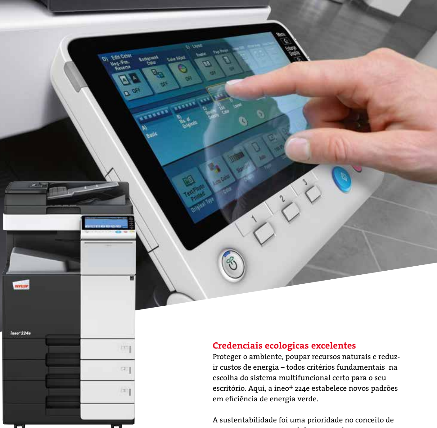
ineo + 224e com cassete de papel (PC-110) e alimentador de documentos dual scan (DF-701)