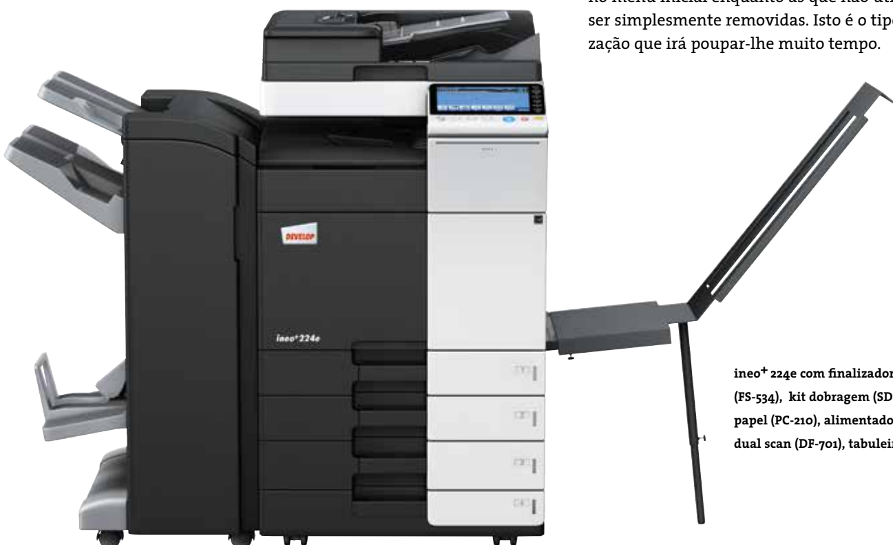
ineo+ 224e com finalizador agrafador (FS-534), kit dobragem (SD-511), cassetes de papel (PC-210), alimentador de documentos dual scan (DF-701), tabuleiro banner (BT-C1e)

Muitos sistemas multifuncionais para o escritório são tudo menos fáceis de usar. Pelo contrário, a ineo+ 224e é pura simplicidade. Um conceito de utilização intuitivo e fácil de entender garante que é tão fácil de usar como o seu smartphone ou tablet. O painel tátil de 9 polegadas vem com funções bem conhecidas como flick&drag, e graças à sua estrutura de navegação por menus, consegue visualizar todas as funções de uma só vez e selecionar a configuração desejada em poucos passos. Funções frequentemente usadas podem ficar no menu inicial enquanto as que não utiliza podem ser simplesmente removidas. Isto é o tipo de personalização que irá poupar-lhe muito tempo.