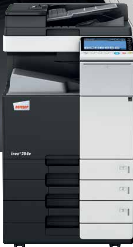
ineo+ 284e com cassete de papel (PC-110) e alimentador de documentos dual scan (DF-701)