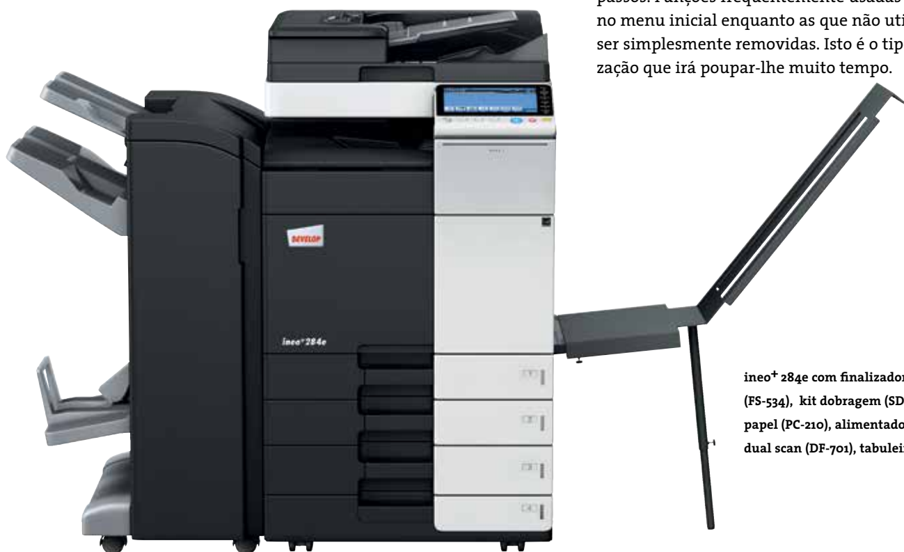
ineo+ 284e com finalizador agrafador (FS-534), kit dobragem (SD-511), cassetes de papel (PC-210), alimentador de documentos dual scan (DF-701), tabuleiro banner (BT-C1e)

Muitos sistemas multifuncionais para o escritório são tudo menos fáceis de usar. Pelo contrário, a ineo+ 284e é pura simplicidade. Um conceito de utilização intuitivo e fácil de entender garante que é tão fácil de usar como o seu smartphone ou tablet. O painel tátil de 9 polegadas vem com funções bem conhecidas como flick&drag, e graças à sua estrutura de navegação por menus, consegue visualizar todas as funções de uma só vez e selecionar a configuração desejada em poucos passos. Funções frequentemente usadas podem ficar no menu inicial enquanto as que não utiliza podem ser simplesmente removidas. Isto é o tipo de personalização que irá poupar-lhe muito tempo.