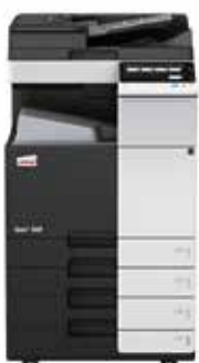
ineo+ 368SF com alimentador de documentos dual scan (DF-704), tableiro de saída (OT-506) e casette de papel (PC-210)

Invista numa ineo+ 368SF e já não fica dependente de lojas externas para os trabalhos especializados como por exemplo convites impressos em papel grosso de alta qualidade. Isso irá poupar-lhe muito tempo e dinheiro. A ineo+ 368 pode lidar com envelopes, papel reciclado, papel pré-impresso, acetatos, muitos outros suportes e até mesmo cartão com uma espessura de até 300 g/m 2 . Estes sistemas podem imprimir numa ampla gama de formatos de papel desde A6 a A4 ou formatos definidos pelo utilizador. E mais, as inúmeras opções de finalização permitem a criação de brochuras de até 80 páginas, cartas dobradas de várias maneiras, manuais agrafados ou faturas furadas. Quase qualquer tipo de trabalho pode ser produzido internamente numa ineo+ 368SF.