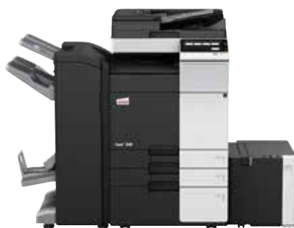
ineo+ 368SF com alimentador de documentos dual scan (DF-704), finalizador de brochuras (FS-534SD), casette de grande capacidade (LU-302) e casette de papel (PC-410)