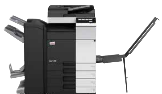
ineo+ 368SF com alimentador de documentos dual scan (DF-704), finalizador de brochuras (FS-534SD) e casette de papel (PC-210)