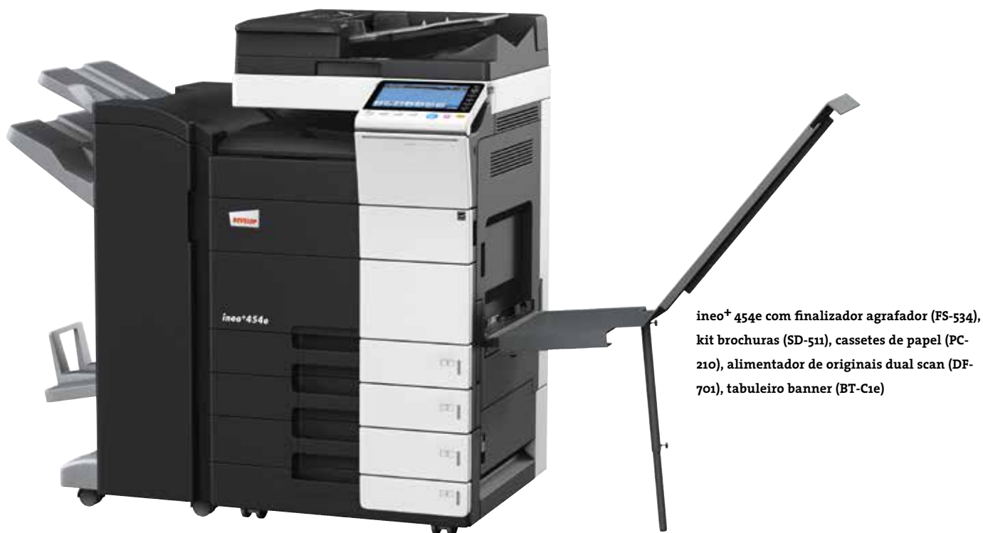
ineo+ 454e com finalizador agrafador (FS-534), kit brochuras (SD-511), cassetes de papel (PC-210), alimentador de originais dual scan (DF-701), tabuleiro banner (BT-C1e)