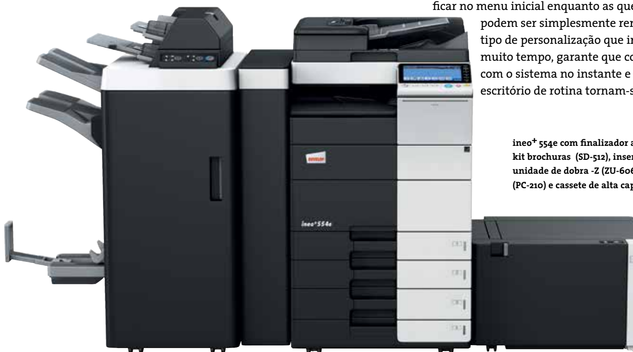
ineo+ 554e com finalizador agrafador (FS-535), kit brochuras (SD-512), insensor (PI-505), unidade de dobra -Z (ZU-606), cassetes de papel (PC-210) e cassette de alta capacidade (LU-204)

Muitos sistemas multifuncionais para o escritório são tudo menos fáceis de usar. Pelo contrário, a ineo+ 554e é pura simplicidade. Um conceito de utilização intuitivo e fácil de entender garante que é tão fácil de usar como o seu smartphone ou tablet. O painel tátil de 9 polegadas vem com funções bem conhecidas como flick&drag ou pinch in&out, e graças à sua estrutura de navegação por menus, consegue visualizar todas as funções de uma só vez e selecionar a configuração desejada em poucos passos. Funções frequentemente usadas podem ficar no menu inicial enquanto as que não utiliza podem ser simplesmente removidas. Isto é o tipo de personalização que irá poupar-lhe muito tempo, garante que consegue trabalhar com o sistema no instante e os trabalhos de escritório de rotina tornam-se mais divertidos.