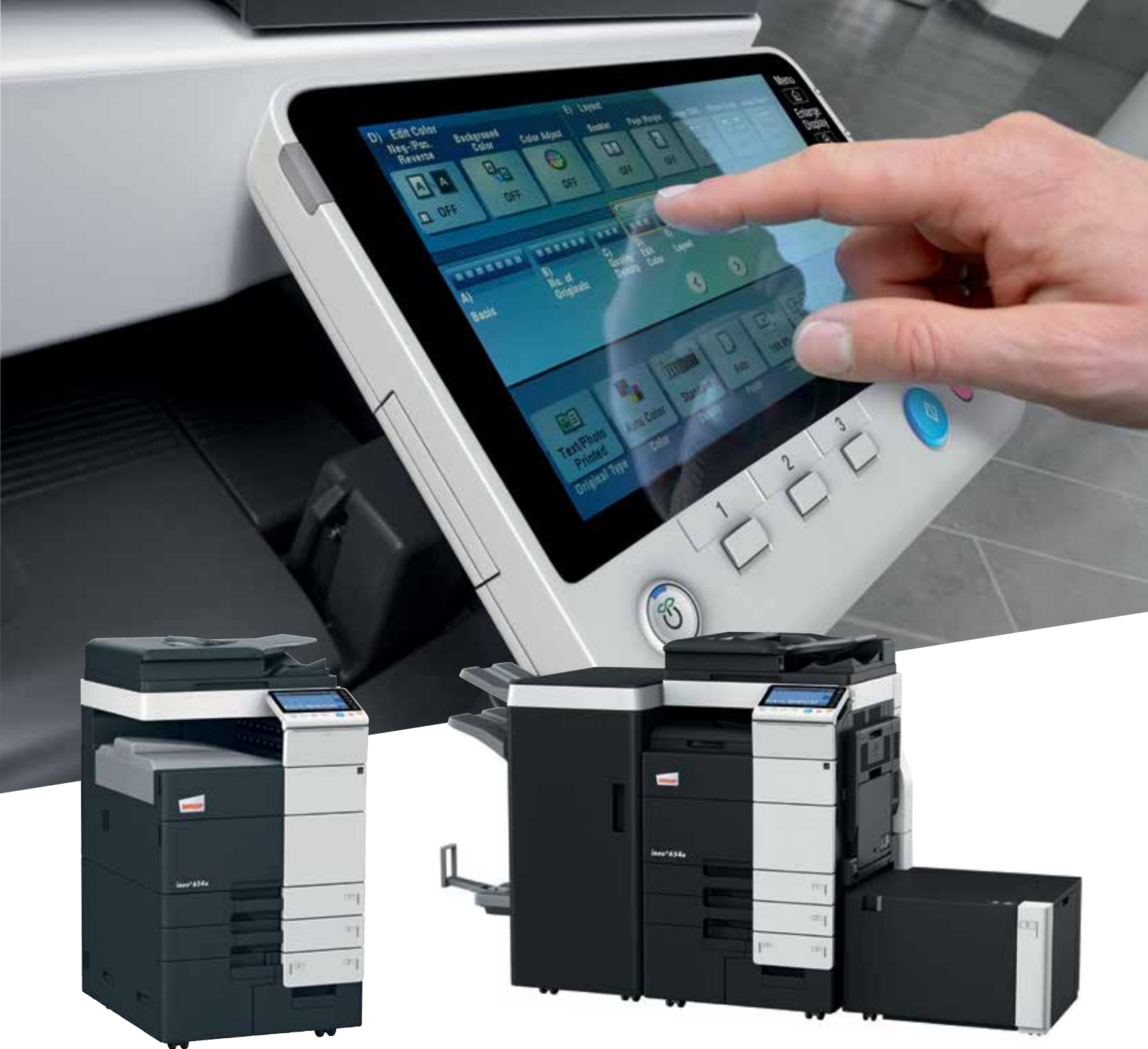
ineo+ 654e com tabuleiro de saída (OT-503)