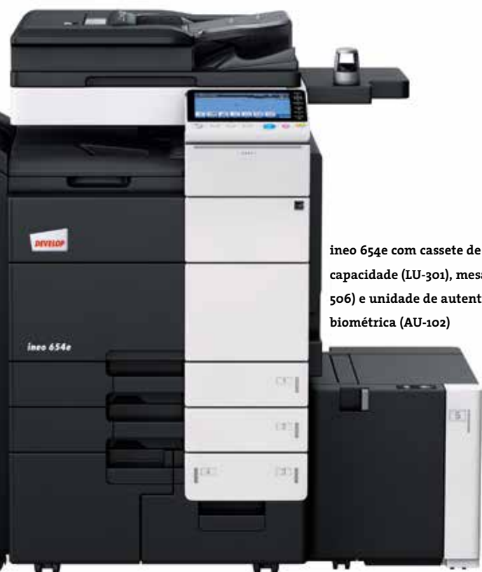
ineo 654e com cassete de alta capacidade (LU-301), mesa (WT-506) e unidade de autenticação biométrica (AU-102)

A ineo 654e imprime e copia a 65 páginas A4 por minuto (ppm). Isto significa que os seus funcionários podem sair de ao pé da máquina e deixá-la a executar qualquer trabalho de grande volume, enquanto continuam com o seu trabalho diário no escritório. No ambiente com vários utilizadores de um dispositivo departamental ou de um escritório centralizado, e num centro de impressão interno, são também desta forma eliminadas filas de trabalhos, ou, no mínimo, são encurtados os tempos de espera. Como esta máquina imprime e copia em modo duplex a toda a velocidade, irá também poupar dinheiro reduzindo o consumo de papel em trabalhos de grande volume.