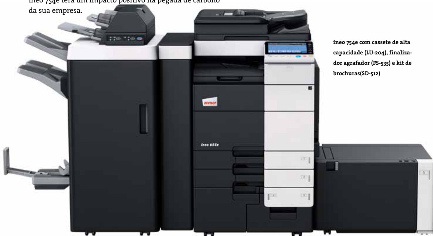
ineo 754e com cassete de alta capacidade (LU-204), finalizador agrafador (FS-535) e kit de brochuras(SD-512)

Ataques de hackers, vírus, programas Trojan: nos dias que correm, nenhum negócio pode dar-se ao luxo de ignorar o desafio que representa a segurança informática. É por esse motivo que a ineo 754e está certificada pela ISO 15408 EAL 3, que é a norma de segurança da indústria para os sistemas multifuncionais. Além disso, também está equipada com inúmeras características de segurança de dados, como a encriptação IPsec, que garante a comunicação segura para todos os documentos que passam através da rede da sua empresa. Não existe o perigo de documentos ou dados confidenciais irem parar às mãos erradas, porque o acesso ao sistema pode ser restringido a utilizadores autorizados através do kit de encriptação do disco rígido standard e da tecnologia de autenticação. Desta forma, garantimos que os seus dados sensíveis se mantêm seguros – agora e no futuro.