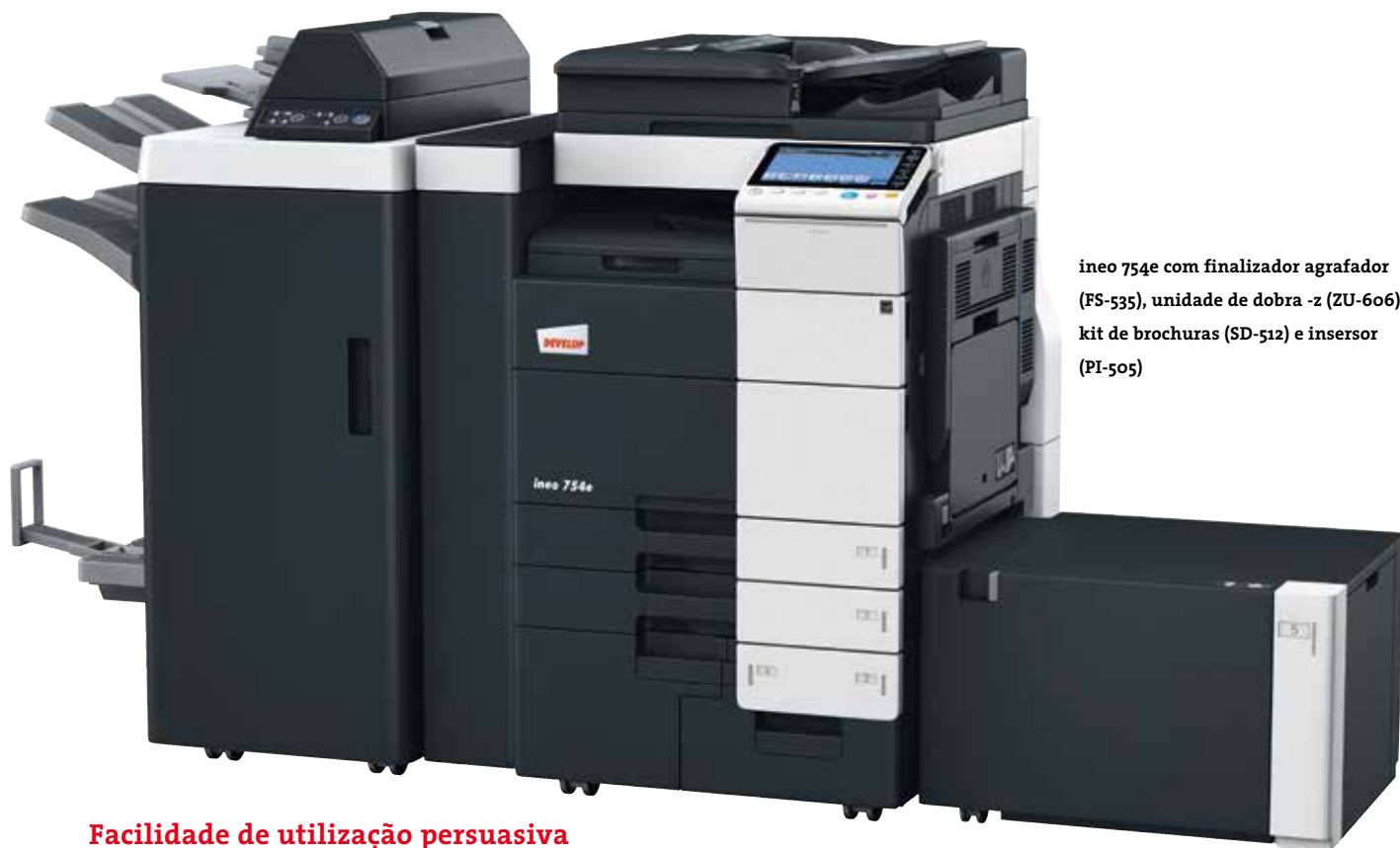
ineo 754e com finalizador agrafador (FS-535), unidade de dobra -z (ZU-606), kit de brochuras (SD-512) e insersor (PI-505)