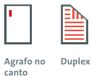
Agrafo no canto Duplex